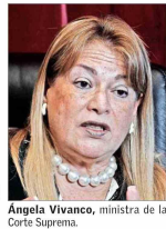
Ángela Vivanco, ministra de la Corte Suprema.