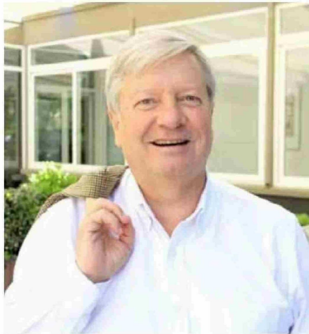
El alcalde George Bordachar dio a conocer, que la reapertura de calle Membrillar se hará pronto realidad.

Bordachar agregó que la comunidad debe saber que sí o sí, la reapertura de calle Membrillar se hace y que solo se están coordinando los últimos detalles para hacer efectiva la decisión que ha dado a conocer públicamente.