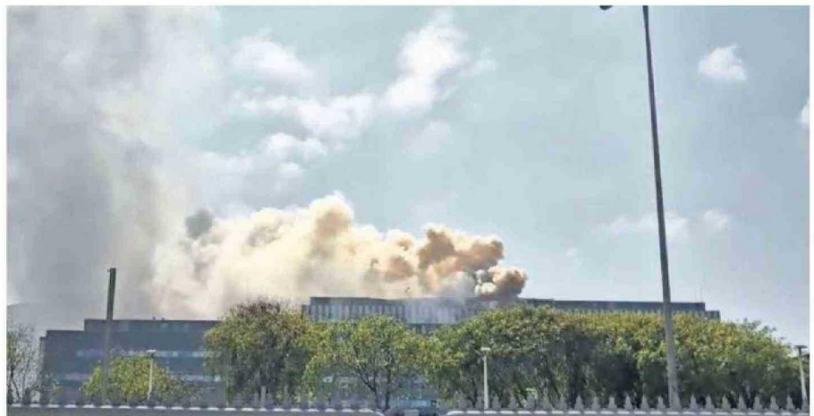
CERCA DE LAS 11 DE LA MAÑANA COMENZÓ EL INCENDIO EN EL CUARTO PISO DEL HOSPITAL REGIONAL DE ANTOFAGASTA.

Además, el reingreso controlado de pacientes y personal comenzó a las 12:16, priorizando la read-