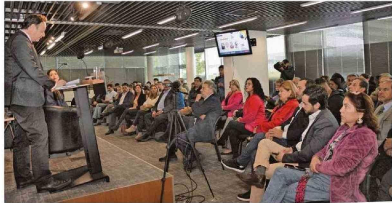
Sodos e invitados de la CChC Valparaíso disfrutaron del debate en su auditorio gremial de Viña del Mar.