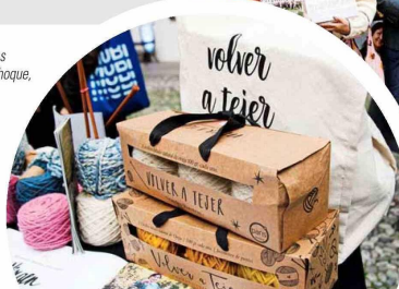
Pack de ovillos de lana del programa “Volver a Tejer”.