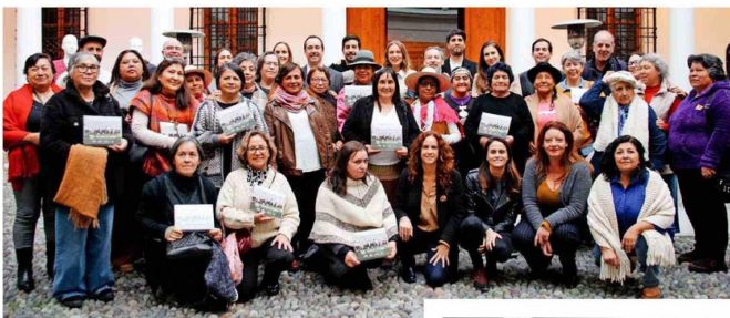
El equipo de “Volver a Tejer” tras la ceremonia y el reconocimiento.

En la instancia, se realizó el lanzamiento de la temporada 2024 de “Volver A Tejer” que contempla una colección limitada de 236 chalecos sin manga de lana de oveja “corriedale” elaborados por cuatro agrupaciones de tejedoras de las regiones de Valparaíso y O’Higgins.