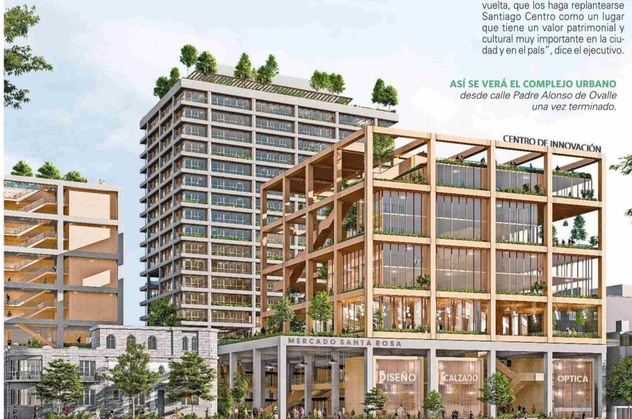
GENITELEZA DE TERRITORIA

ASÍ SE VERÁ EL COMPLEJO URBANO desde calle Padre Alonso de Ovalle una vez terminado.