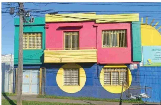
JARDÍN UBICADO en calle Arturo Prat, robo el miércoles 4 septiembre 2024.