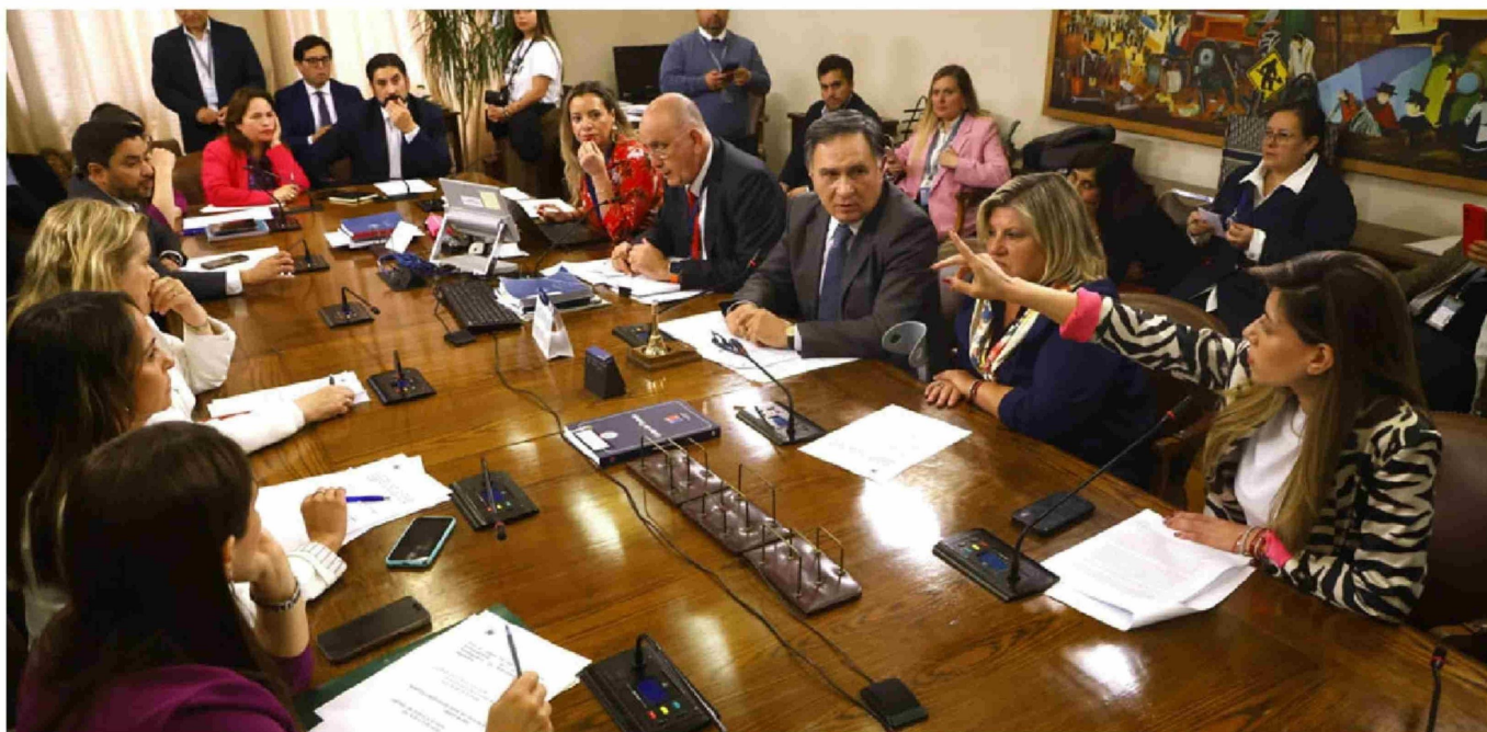
► Hasta el 30 de enero tiene plazo la comisión para dilucidar las responsabilidades políticas en el manejo de la crisis que generó la denuncia contra Manuel Monsalve.

La censura en contra del diputado Miguel Mellado (RN) fue rechazada este lunes, sin embargo, las tensiones dentro de la instancia permanecen y algunos temen que la indagación parlamentaria no arroje resultados satisfactorios.