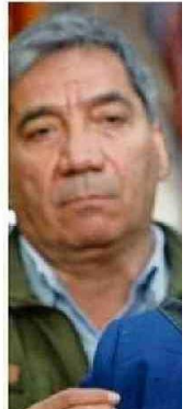
Ministra Jara dijo q

Por otra parte, y ante los cuestionamientos por una posible demora en presentar un proyecto para ampliar el subsidio, el ministro Pardow explicó ayer a radio ADN que "la ventana para esa discusión sobre viabilizar nuevos recursos se abrió recién cuando se materializó el alza", y agregó que el primer subsidio fue con "los recursos que pudimos movilizar en ese momento (...) Nuestra disposición siempre estuvo en aumentar el número de beneficiarios, pero con responsabilidad fiscal".