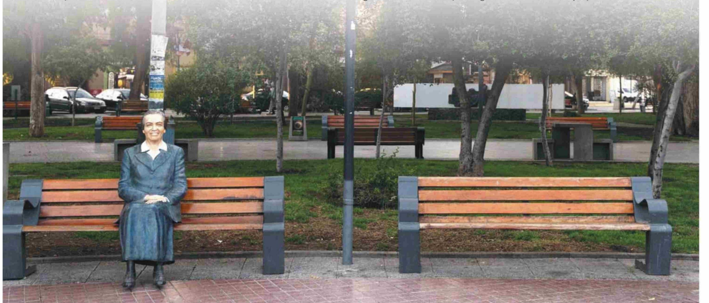
La figura de la poetisa y Premio Nobel de Literatura, Gabriel Mistral, está íntimamente ligada al valle por ser éste, su tierra de origen.

Esta energía, según el alcalde, no solo atrae a quienes buscan escapar del bullicio urbano, sino que también potencia la conexión entre los visitantes y el entorno natural, ofreciendo una experiencia enriquecedora para el cuerpo y el alma.