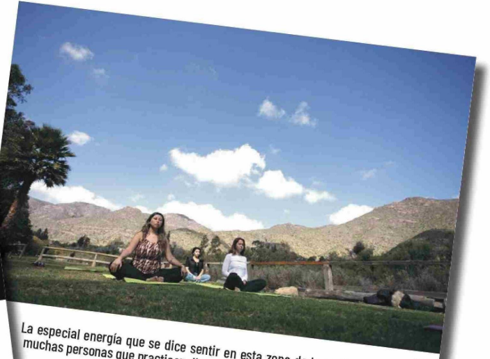
La especial energía que se dice sentir en esta zona de la región, ha atraído a muchas personas que practican disciplinas como el yoga y la meditación. EFE

Capel o ABA Pisquera, garantizando la oportunidad de explorar de cerca el proceso de destilación y disfrutar de las diversas variedades de este emblemático destilado chileno.