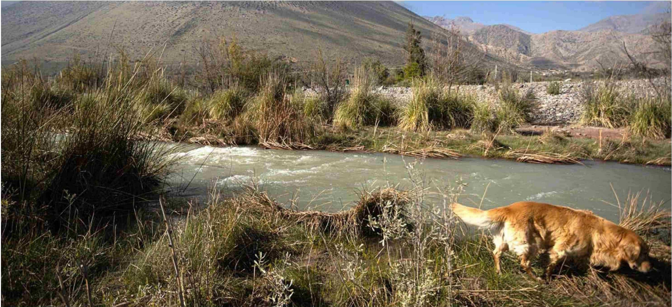
Agua, desierto, montañas y cielo azul son parte de la esencia del Valle del Elqui, uno de los destinos turísticos más importantes de la Región de Coquimbo.

Título: Valle del Elqui: La apuesta en Chile por un turismo pausado y sostenible