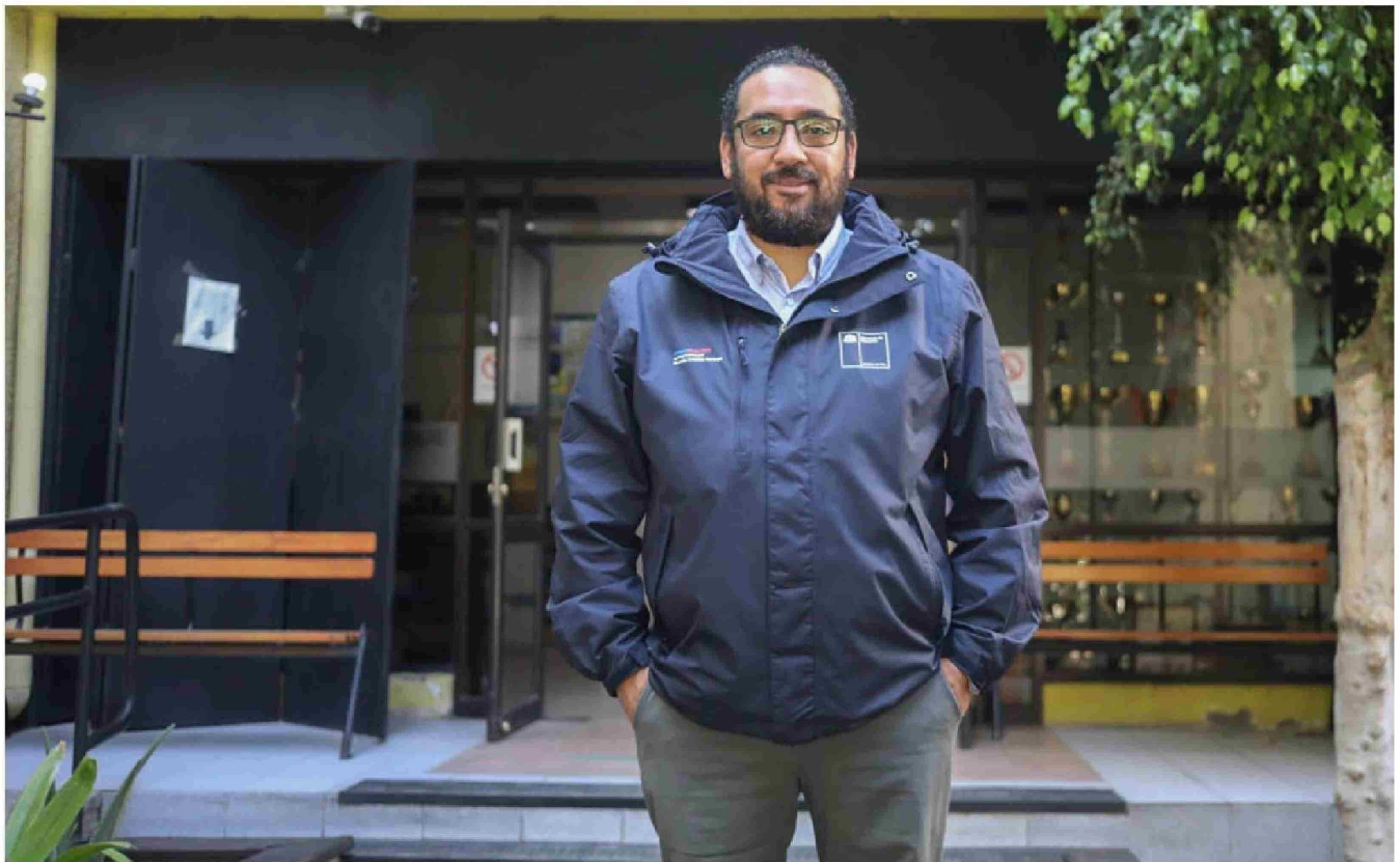
► Los 97 días de gestión de Nicolás Cataldo (PC) como titular de Educación se han caracterizado por las movilizaciones, puertas adentro y puertas afuera.

Sin ir más lejos, la Comisión de Educación del Senado propuso formalmente pausar el proceso, misma solicitud que han hecho algunas bancadas, municipios y expertos. Asimismo, hace menos de dos semanas senadores y diputados -principalmente de oposición y DC- de la comisión mixta encargada de analizar el Presupuesto 2024, rechazaron los recursos para los