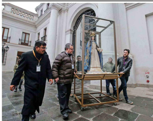
Imagen de Virgen de Lo Vásquez visita La Moneda

DEFENSOR CONCRETA PETICIÓN DE "COPIA" DEL TELÉFONO DE SU HERMANO Y ADELANTA QUE HARÁ PÚBLICAS CONVERSACIONES RELACIONADAS CON "LOBBY" Y "TRÁFICO DE INFLUENCIAS" | C 1 y C 2