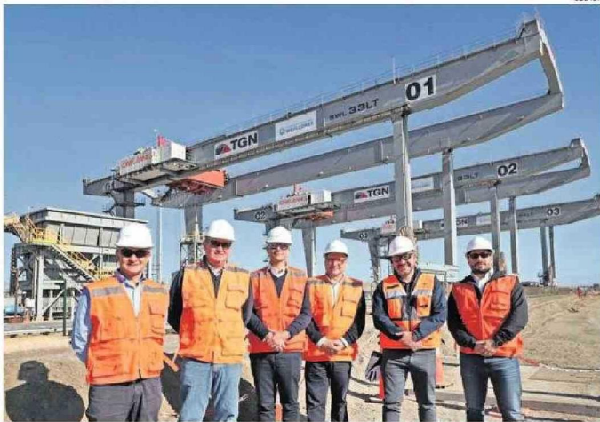
REGISTRAN UN 87% DE AVANCE Y SE ESPERA QUE ESTÉN OPERATIVAS DURANTE 2025.

Obras forman parte del plan de desarrollo que tiene la empresa para impulsar la competitividad del puerto regional.