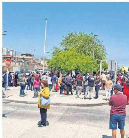
LA EMERGENCIA OBLIGÓ A EVACUAR A 2.600 PERSONAS.