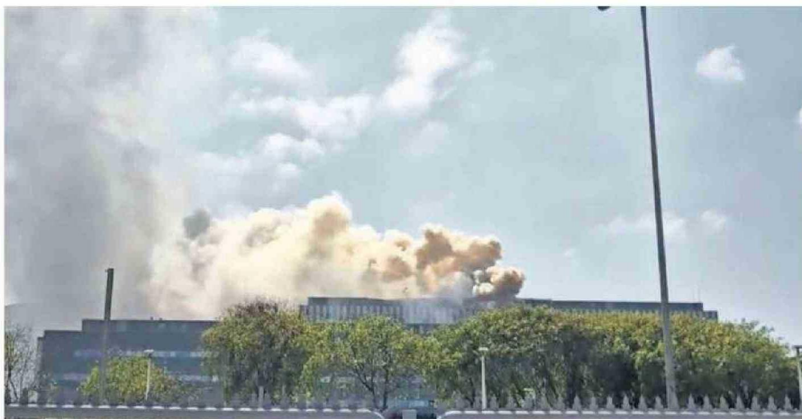
CERCA DE LAS 11 DE LA MAÑANA COMENZÓ EL INCENDIO EN EL CUARTO PISO DEL HOSPITAL REGIONAL DE ANTOFAGASTA.

Además, el reingreso controlado de pacientes y personal comenzó a las 12:16, priorizando la read-