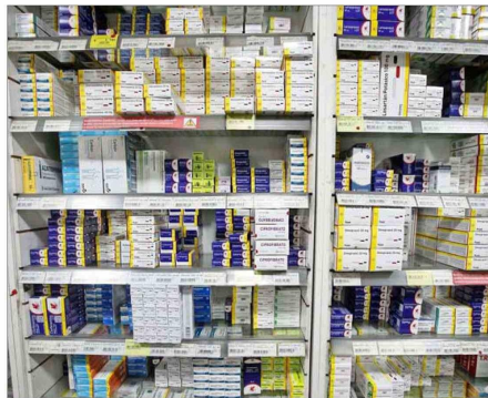
RECOMENDACIÓN.—Al momento de comprar un medicamento, el consejo de expertos es solicitar el bioequivalente y no el nombre de fantasía.

productos genéricos sin marca, diferencias que implican un ahorro potencial anual estimado en US$ 283,2 millones.