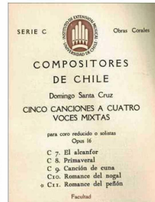
El compositor escribió cuantioso material para voces.