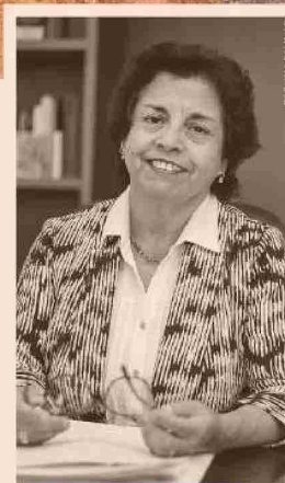
AURORA WILLIAMS, MINISTRA DE MINERÍA

La situación de las empresas se monitorea desde Sernageomin,