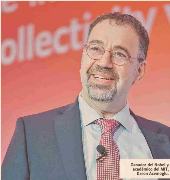
Ganador del Nobel y académico del MIT, Daron Acemoglu.