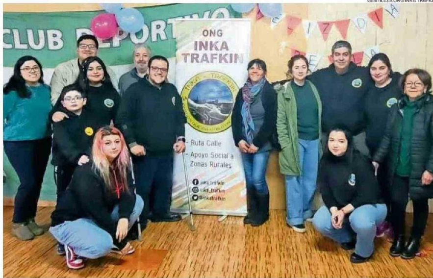
LA ONG INKA TRAFKIN FUNCIONA CON VOLUNTARIOS Y DE MANERA INDEPENDIENTE. RECIBEN A NUEVOS INTEGRANTES "QUE SEAN CONSTANTES".

"Cada lugar al que vamos es como una novedad, porque llegamos con el Viejo Pascuero, con regalos, juegos, dinámicas y diferentes actividades. Nos piden que volvamos, y se va todo el año. Son localidades que, aunque quizás no estén tan aisladas en términos de modernidad, tienen muchas necesidades. Justamente, la ayuda no llega a esos lugares porque están lejos, o porque a veces el montaje de las actividades es complicado. Sin embargo, nuestro objetivo