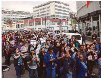
POR UNOS MINUTOS, FUNCIONARIOS SALIERON A LAS CALLES.

Con un diagnóstico claro, ofuscados en buscar res-