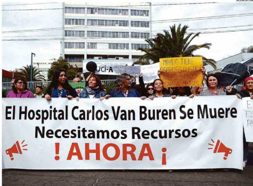
TRABAJADORES DEL ÁREA DE LA SALUD EMPLAZARON AL GOBIERNO. ASEGURAN QUE SE NECESITAN RESPUESTAS A NIVEL CENTRAL.

En medio de este revuelo, la consigna de los funcionarios de la salud ha sido que el panorama es aún más catastrófico que el del año 2019, ocasión en la que el recinto porteño vi-