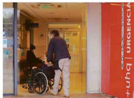
A LA SEREMI DE SALUD SE PIDE INFORMACIÓN DE AFECTADOS.

En el marco del envío de estos oficios por el tribunal de alzada, el abogado patrocinante de esta acción recordó que el recur-