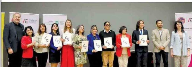
Entrega de diplomas TAMK a profesores de la Escuela Presidente Balmaceda D-48 de Calama.