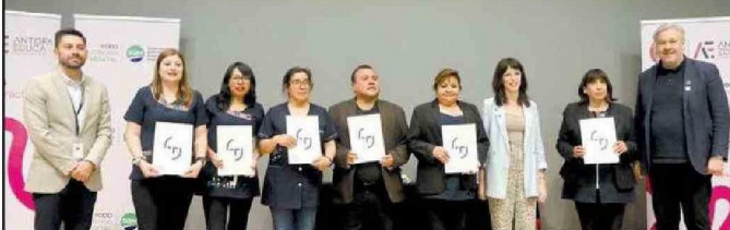
Profesores del Complejo Educacional de Toconao de San Pedro de Atacama reciben sus diplomas TAMK (Universidad de Ciencias Aplicadas de Tampere).