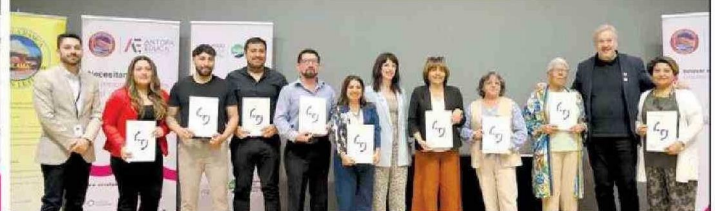
Entrega de diplomas TAMK a profesores del Liceo Técnico Profesional Científico Humanista de María Elena.