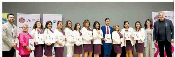
Profesores de la Escuela Valentin Letelier D-131 de Calama reciben sus diplomas TAMK (Universidad de Ciencias Aplicadas de Tampere, Finlandia).