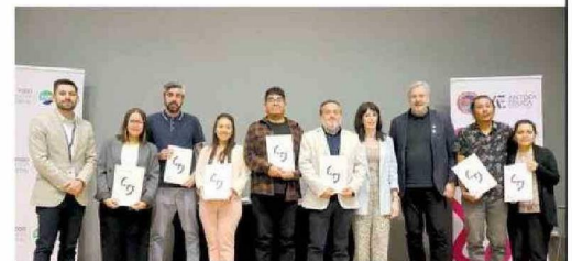
Entrega de diplomas TAMK a profesores del Complejo Educacional de Toconao de San Pedro de Atacama.