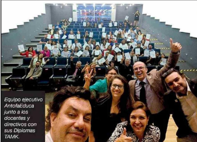
Equipo ejecutivo AntofaEduca junto a los docentes y directivos con sus Diplomas TAMK.