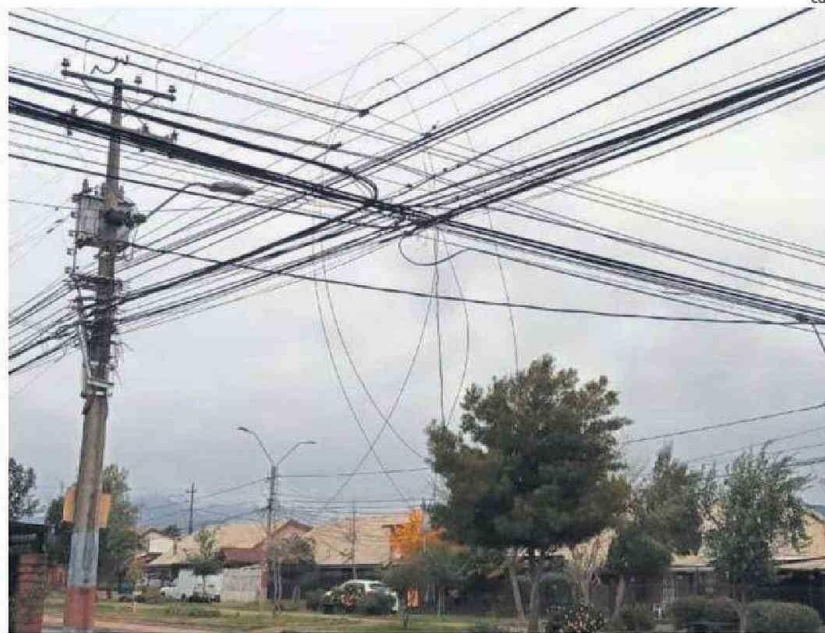
EL DELITO NO SÓLO AFECTA LAS INSTALACIONES DE LA COMPAÑÍA, SINO TAMBIÉN A SUS CLIENTES.

Lo anterior equivale a más de 45 toneladas de cobre sustraídas por bandas delictuales, lo que también provocó que más de 165 mil clientes vieran interrumpido su suministro, a raíz de la acción de los delincuentes.