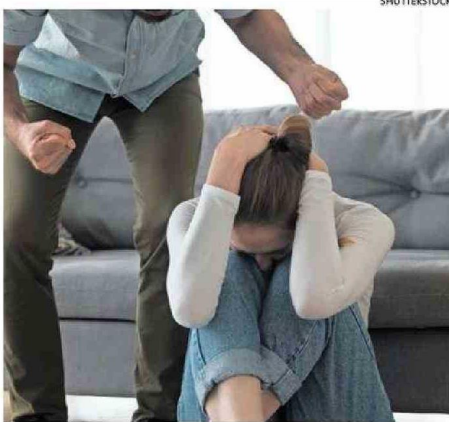
EL INFORME SE ENFOCA EN LAS PAREJAS HETEROSEXUALES.