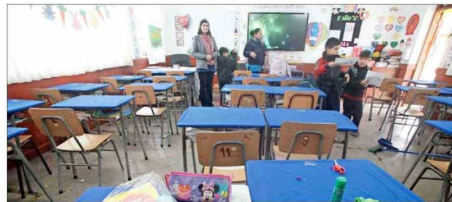
EXÁMENES LIBRES.— En la última década, casi se han cuadruplicado los alumnos que recurren a dicha fórmula. Un 23% de los desvinculados están inscritos.

cho de que aún estemos por encima de los niveles de deserción que teníamos antes de la pandemia, evidencia que las políticas implementadas por el Mineduc son insuficientes para abordar el problema de fondo".