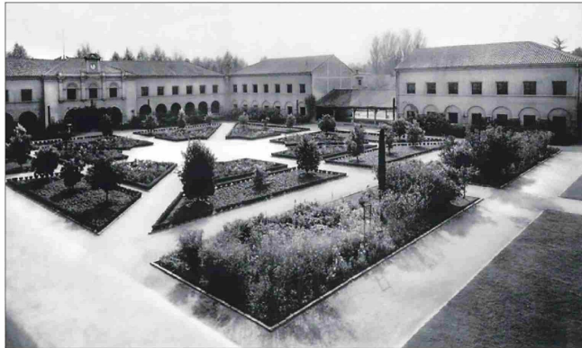
Ayer y hoy del frontis. Si bien ha cambiado el entorno, el reloj es el mismo de hace 94 años.

Título: Conozca los rincones del ex colegio Santiago College en Providencia: reloj de casi 100 años aún da la hora