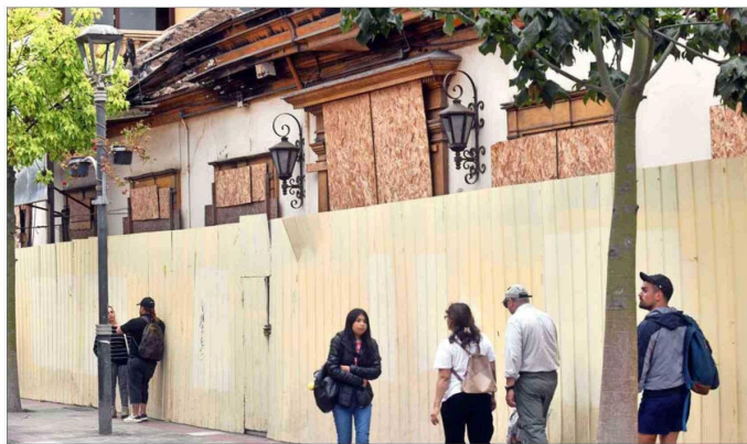
ESPACIOS. — El trabajo de renovación considera una intervención de 2.132 m 2 , en donde se recuperarán espacios de librería, sala de lectura y salón multiuso, entre otros.

Tras a la muerte de su dueño, la casa fue heredada por su esposa, Paula Piñera Aguirre. Ya en el siglo XX, el fallecido expresidente Sebastián Piñera alojó en ella durante numerosos veraneos, al igual que sus hermanos.