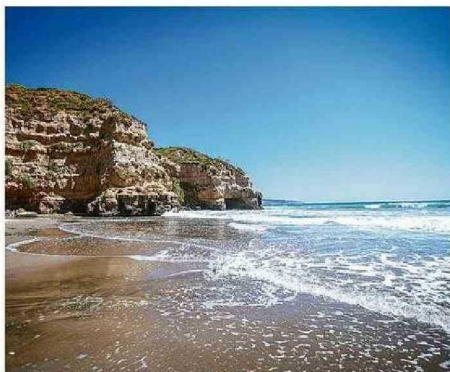
EN LA BASE DEL ACANTILADO DE QUIRILLUCA HAY DOS CAVERNAS.

En el caso particular de la Región de Valparaíso,