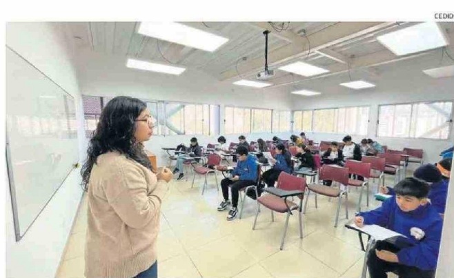
LAS EVALUACIONES TENÍAN DISTINTOS NIVELES DE DIFICULTAD.

Selles también destacó el valor de este tipo de actividades para el desarrollo integral de los jóvenes. "Este tipo de