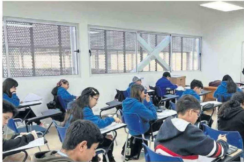
LAS PRUEBAS CONSISTÍAN DE TRES PREGUNTAS.

En cuanto a las pruebas, Pacheco explicó que los examinadores estaban trabajando de manera intensa para evaluar los resultados de las distintas delegaciones. “Las pruebas se están llevando a cabo de manera rigurosa, y los resultados los tendremos aproximadamente a la una de la mañana. Luego, un equipo de decodificadores se encargará de asignar las medallas de oro, plata y bronce a