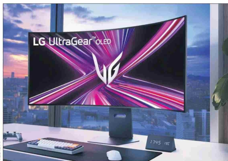
Así luce el LG UltraGear Oled Flexible en su máximo nivel de curvatura.

basadas en las preferencias del usuario o el momento del día, añadiendo un toque estético que transforma la pantalla en una pieza decorativa.