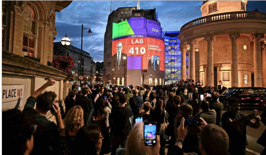
KIER STARMER, según las proyecciones preliminares, podrá gobernar con una mayoría más que cómoda de 410 escaños.

El resultado previsto no es solo un excelente logro por sí mismo, sino que también marca una suerte de renacimiento para el Partido Laborista, que en las elecciones anteriores de 2019 había