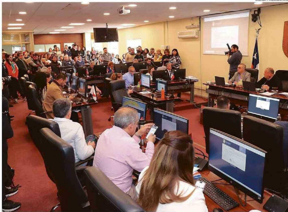
LA SESIÓN DE AYER DEL PLENOP FUE LA ÚLTIMA PRESIDIDA POR RODRIGO MUNDACA ANTES DE SU RECESO DE CAMPAÑA A LA REELECCIÓN.

En el caso de los proyectos destinados a salud, destaca la aprobación de 3 mil millones de pesos para el "Programa de recuperación de la salud de población en lista de espera quirúrgica no GES", postulado por el Servicio de Salud Viña del Mar Quillota Petorca. Estos recursos, destacó el presidente de la comisión de Salud del Consejo