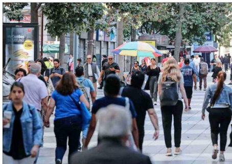
Sobre el alza de contratos indefinidos, la Encla señala que esta "puede interpretarse como un reflejo de dinámicas laborales que favorecen una mayor estabilidad".

En contraste, las modalidades de contrato a plazo fijo y por obra o faena representan el 14,1% y el 8,4% del total, respectiva-