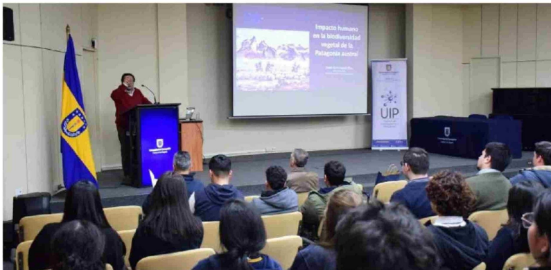
ESTUDIANTES ASISTIERON a la charla dictada en Los Ángeles.

Además, evitar el abandono de perros, los que pueden atacar a la fauna nativa. Seguir las directrices de los guardaparques y participar en actividades de ecoturismo que promuevan la educación y conservación.