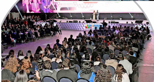
Una amplia convocatoria tuvo el IX Encuentro por los Jóvenes de la Alianza del Pacífico.