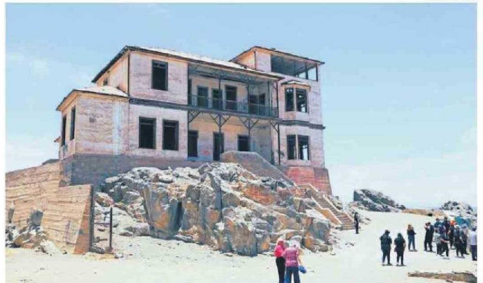
UNO DE LOS PASEOS DESARROLLADOS FUE EN LA LOCALIDAD DE GATICO.