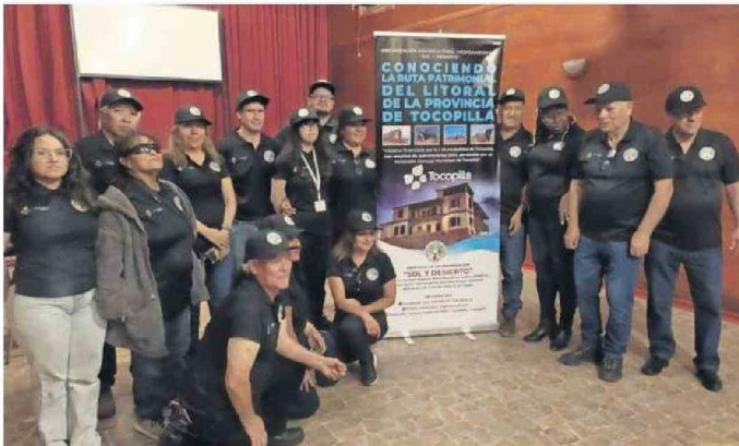
LOS INTEGRANTES DE LA AGRUPACIÓN SOL Y DESIERTO DE TOCOPILLA.