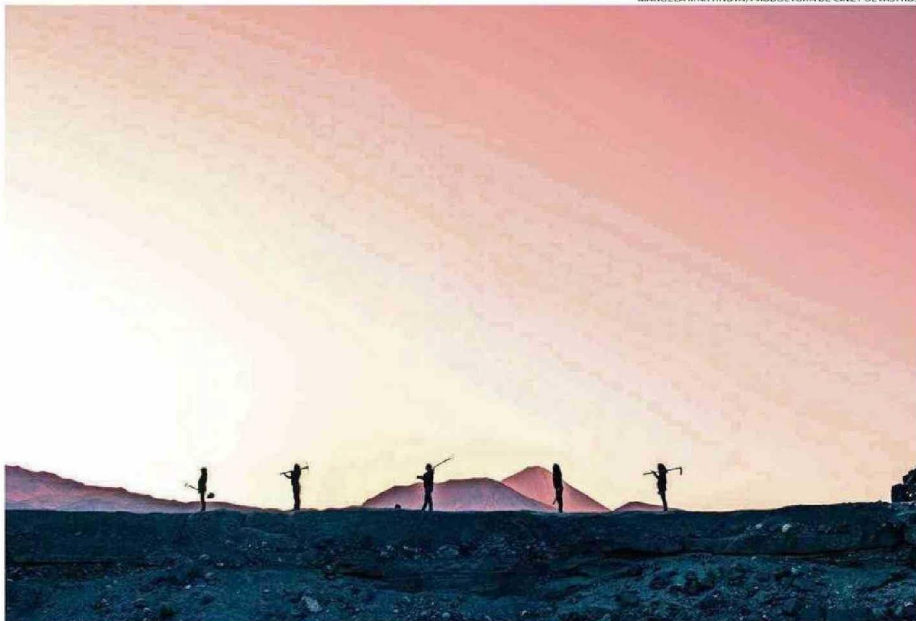
MANUELA MARTINOVA/PRODUCTORA DE CINE POETASTROS

tado en su día a día diferentes trastornos debido a la escasez hídrica para el consumo de agua y sus usos de subsistencia”, sostuvieron en un comunicado.