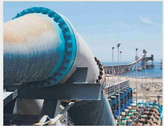
US$ 1.500 millones será la inversión en el proyecto de agua en Centinela.