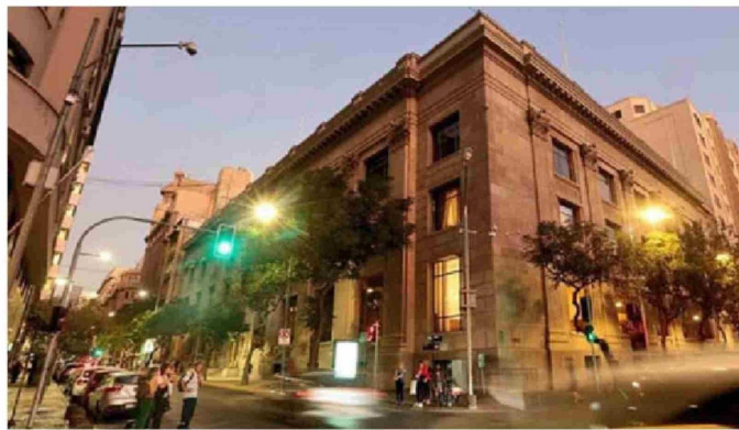
EVOLUCIÓN DE LA ACTIVIDAD DE ECONÓMICA