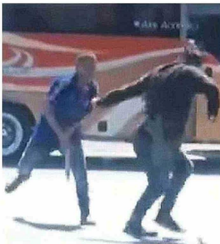
LA PELEA A PALOS OCURRIÓ EN PLENA LOSA DEL RODOVIARIO.

Y a través de una declaración pública lamentan estos hechos. "El miércoles 12 de febrero, pasadas las 17 horas, se registró un robo de especies al interior de un vehículo en el sector de estacionamientos del terminal. Las imágenes captadas por nuestras cámaras de seguridad muestran a un grupo de delincuentes ingresando al lugar y, de manera furtiva, cometiendo el delito", argu-