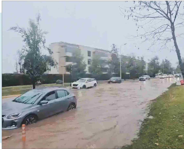
CAPTURA DE PANTALLA

Cerca de las 10.30 de este viernes, horas la Municipalidad de Las Condes recomendaba evitar circular por Avenida La Plaza a la altura del 1451, debido a que se encontraba parcialmente inundada. Una vez cortado el tránsito de la avenida mencionada, se habilitó una sola vía de circulación habilitada. Un equipo con un camión Jet llegó al lugar para realizar trabajos de remediación. Otras calles anegadas fueron Francisco Bulnes Correa, a la altura del 2328; Alonso de Córdova, en 4212; Vespucio Sur 507, entre otras. Desde el municipio anunciaron que sus equipos fueron desplegados a los distintos puntos de la comuna afectados.