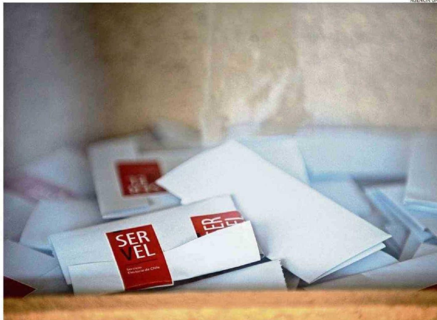
EL 26 Y 27 DE OCTUBRE SE LLEVARÁN A CABO LAS ELECCIONES EN EL PAÍS.

Chillán atraviesa un período socioeconómico complejo, caracterizado por una disminución en la calidad de vida y crisis en áreas críticas como seguridad,