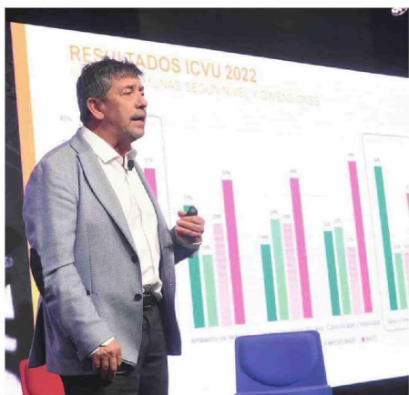
DURANTE LA ENTREGA DE LOS RESULTADOS DE LA CCHC.

Estudio de la Cámara Chile de la Construcción comparó los resultados de 2021 y 2022, incorporando el impacto de la pandemia en los habitantes de la capital regional.