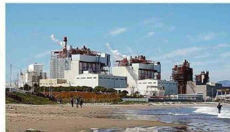
RECURRIÓ DE PROTECCIÓN POR EPISODIOS OCURRIDOS EN 2022 Y 2023.

El próximo paso, anticipó, “es que nosotros vamos a revisar entre hoy y el fin de semana los detalles conversados con las asociaciones de funcionarios y comunicar nuestras conclusiones a las respectivas directivas”.