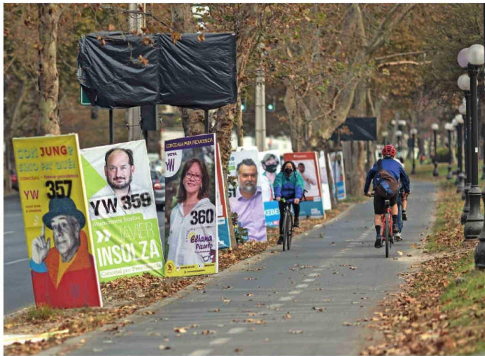
La pasada elección de alcaldes y concejales fue en abril de 2021, en plena pandemia de coronavirus..

Esta nueva etapa implica para los 18.738 candidatos acercarse a los más de quince millones de electores (15.450.377 exactamente), quienes vuelven a ser obligados a sufragar, por lo que se calcula desde el