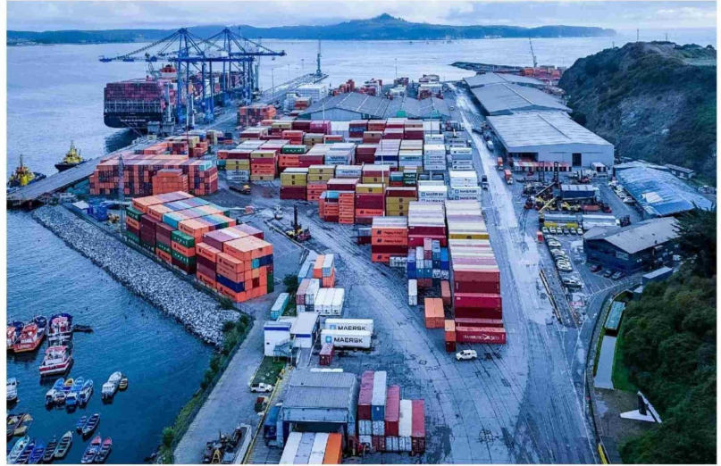
LA REGIÓN ALCANZÓ el 6° lugar a nivel nacional, situándose por encima del promedio nacional.

Uno de los principales factores que explica el bajo rendimiento en inversión pública es la disminución de recursos destinados a la región en com-