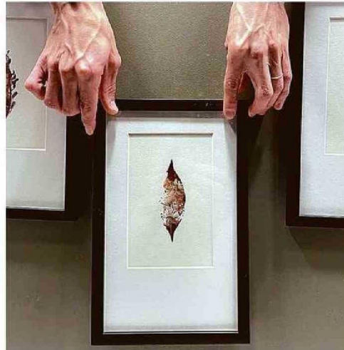
EN LAS OBRAS YACE LA FIGURA DE UNA PLANTA SECA.