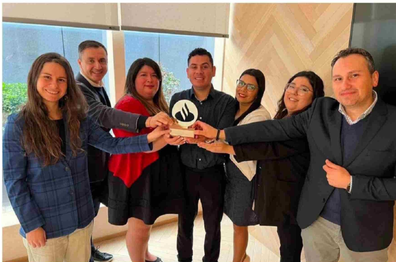
EN LA CAMPAÑA se reunieron más de 2 mil firmas

suma a Colombia como uno de los pocos países de la región en contar con esta función, marcando un importante avance en inclusión y accesibilidad tecnológica.