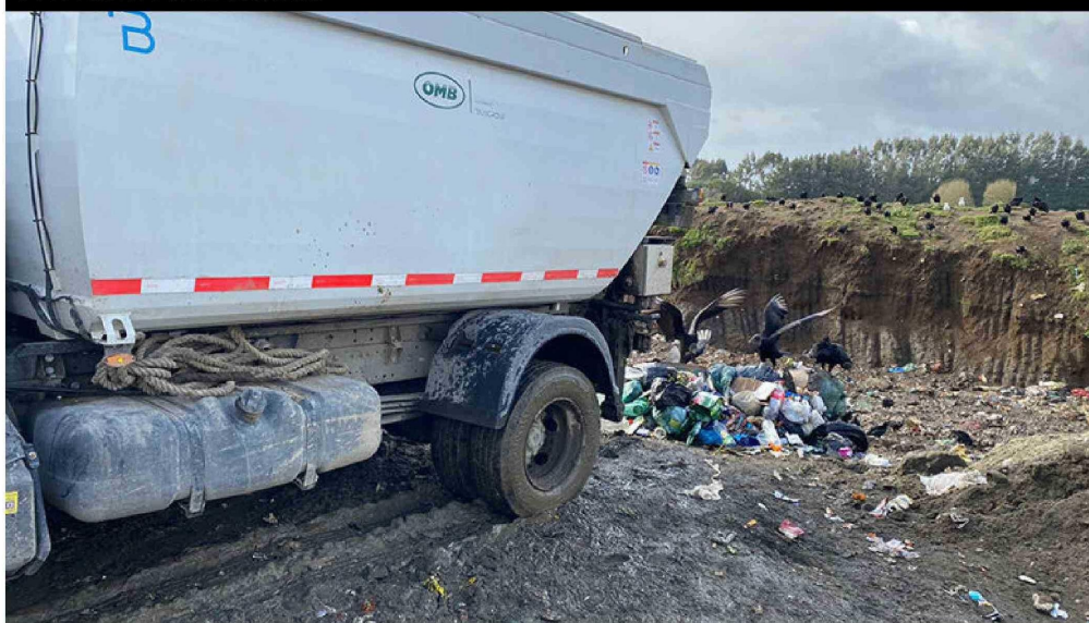
DICIEMBRE 2023.