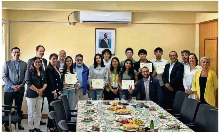
EN EL ENCUENTRO, AUTORIDADES ENTREGARON UN DIPLOMA A CADA UNO DE LOS ESTUDIANTES QUE LOGRARON LA DISTINCIÓN A LA TRAYECTORIA EDUCATIVA.

En tanto, acerca de sus resultados, contó que para la única prueba que estudió fue para la de Historia, "y fue en la que me fue peor de las tres. Es curioso eso, y creo que tiene que ver con que la gente tiene más facilidades para ciertas cosas y cada quien tiene su forma de estudio. De hecho, me sorprendió que me haya ido tan bien en la